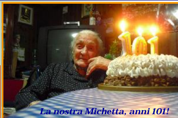
La nostra Michetta, anni 101!

Se vuoi festeggiare una ricorrenza o ricordare un evento inviaci la foto, la pubblicheremo sul giornalino.